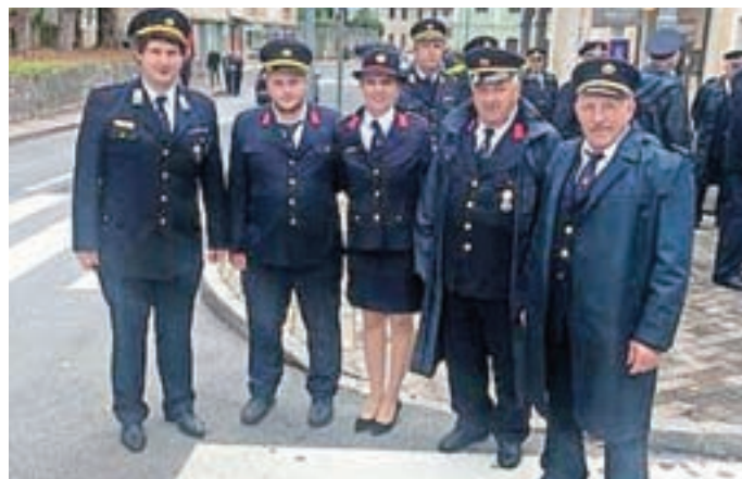
Udeleženci parade GZS