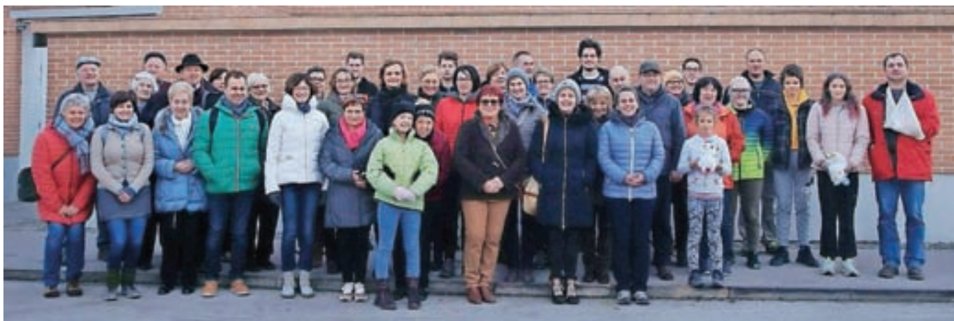
Jezerski izletniki v Podutiku