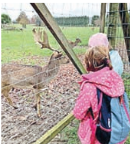
V živalskem vrtu so se učenci učili, kako se po nemško reče živalim

Drugi termin tečaja je bil 2. novembra, in ker je bila tema učenje izrazov za živali, smo tečaj izvedli na terenu. Podali smo se v živalski vrt v kraju Rosegg ob Vrbskem jezeru v Avstriji. Med sprehodom po živalskem vrtu smo spoznavali, kako se v nemščini imenujejo posamezne živalske vrste. Na zaključni prireditvi pa so se otrokom pridružili starši, ki so tako lahko neposredno spremljali, česa so se otroci naučili. Ogledali pa so si tudi plakate, ki so jih otroci ustvarili na prvi delavnici. Ob zadostnem zanimanju je možno tečaj organizirati tudi v prihodnjem letu, zahtevnost tečaja pa bo prilagojena željam in potrebam otrok.