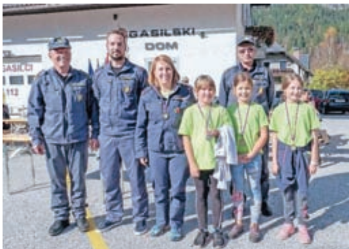
Pionirke (prvo mesto)