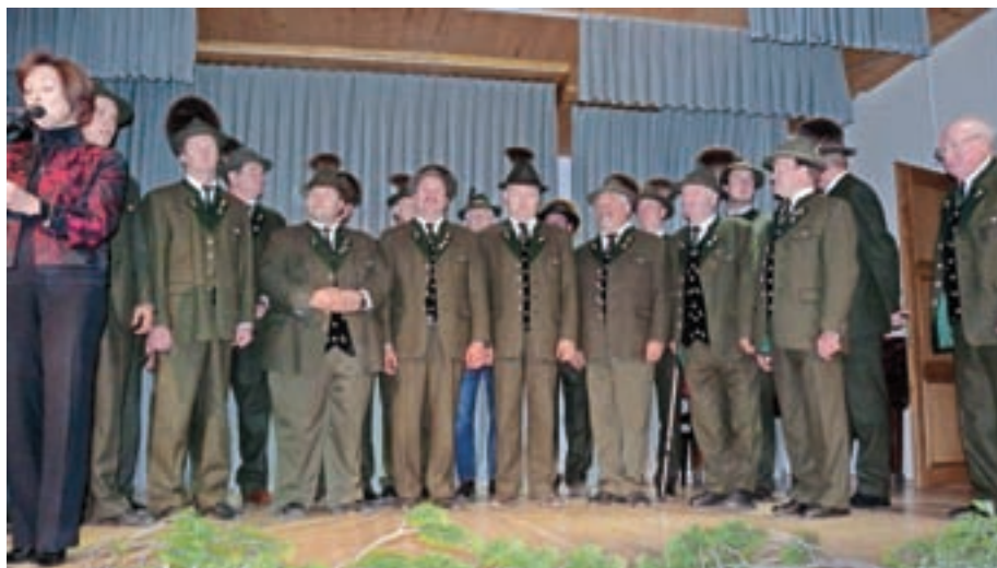
Nastopil je tudi Lovski moški pevski zbor iz Železne Kaple