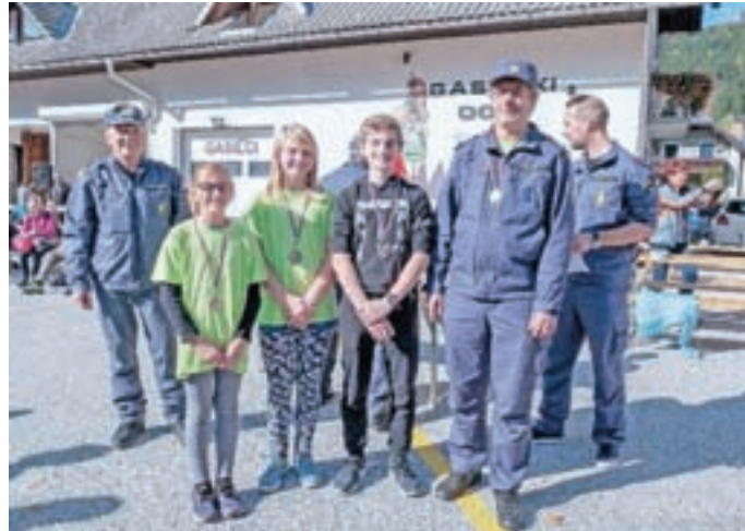
Mladinci (tretje mesto)